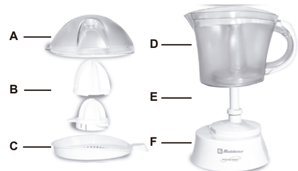
CEKM-40 PB CEKM-40 PN